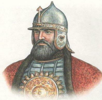
Пожарский Дмитрий Михайлович

который внезапным ударом по флангу войск гетмана Ходкевича сыграл важную роль в достижении общего перелома в ходе сражения. После окончания военных действий участвовал в Земском соборе 1613 года, призвавшего царствовать династию Романовых. На другой день после венчания на царство Михаил Фёдорович пожаловал Минину чин думного дворянина, введя его в состав Боярской думы, и вотчину в Нижегородской губернии.